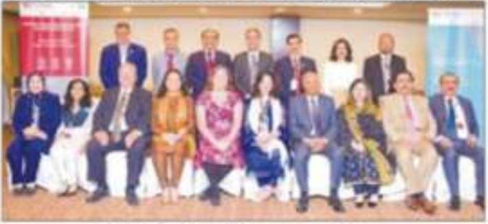
یونورسٹی آف کے زیر اہتمام 16 پاکستانی یونورسٹیوں کے وی سیز کیلئے اسٹریٹجک پلاننگ ڈائلاگ کے شرکاء کا گروپ فوٹو

پتاور (پور پورٹ) یونورسٹی نے اپنے اعلیٰ کیا۔ پبلک سیکر یونورسٹیوں کے سربراہان نے اس تعلیمی نظام کو مضبوط بنانے کے پروگرام کے ڈائلاگ میں شرکت کی اور تعلیمی معیار کی بہتری کے تحت 16 پاکستانی یونورسٹیوں کے وائس چانسلرز نے اپنے اپنے اسٹریٹجک منصوبے پیش کئے جو ہر کے لیے ایک اسٹریٹجک پلاننگ ڈائلاگ کا انعقاد یونورسٹی تیار کر رہی ہے۔ اس صفحہ پر پتہ 68