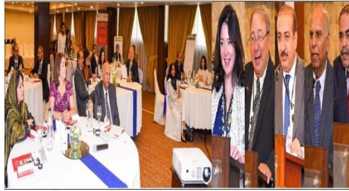
ٽنڊو ڄام: زرعي يونيورسٽي ۾ ڪوئابل تقريب کي مقرر خطاب ڪري رهيا آهن

ملڪ جي 16 يونيورسٽين جي وائيس چانسلرن تي ٻڌل اسٽريٽجڪ پلاننگ ڊائلاگ تقريب منعقد ڪئي وئي